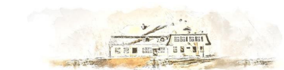
Rysunek 4 (MHN) - dwór w Będominie