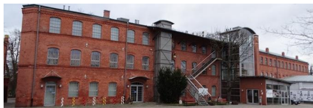
Fot.: 7 (MW) – Muzeum Wisły w Tczewie

To placówka promująca dziedzictwo regionu Kociewia. Tu swoje ekspozycje otworzyło Muzeum Wisły, będące oddziałem Narodowego Muzeum Morskiego w Gdańsku.