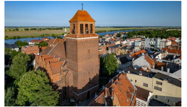
Fot.: 8 (PT) – kościół farny pw. Podwyższenia Krzyża Świętego

To najstarszy zabytek w mieście. Pochodzi z XIII wieku. Jest to trzynawowa świątynia zbudowana w stylu nadwiślańskiego gotyku z barokowym wystrojem wnętrza. W 1993 r., podczas remontu, odkryte zostały trzy zamurowane wnęki, a w niszach ujawniły się kolejne warstwy malowideł.