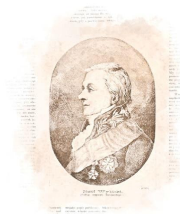
Rysunek 2 – Józef Wybicki