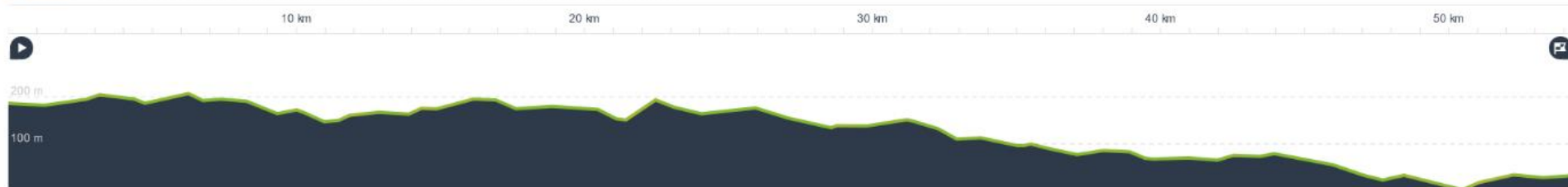
Mapa.: 1 - Orientacyjna trasa rajdu rowerowego –ok. 55 km (może ulec zmianie)

Wysokość Nie wybrano żadnego odcinka Wyprawy. Żeby zobaczyć statystyki, kliknij i przesunij wskaźnik poniżej.