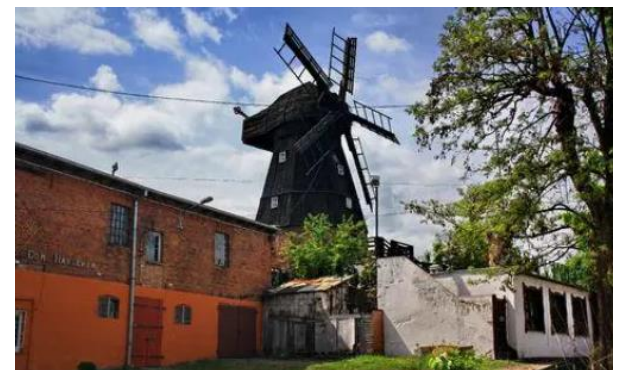
Fot.: 9 (PT) – Tczew - wiatrak typu holenderskiego z XIX w.

Drewniany, podmurowany, z obrotową głowicą; zrekonstruowany w 1950 r. wiatrak jest turystycznym unikatem pomorskiego krajobrazu miejskiego. Posiada rzadko spotykane pięcioramienne skrzydło i obrotową głowicę.