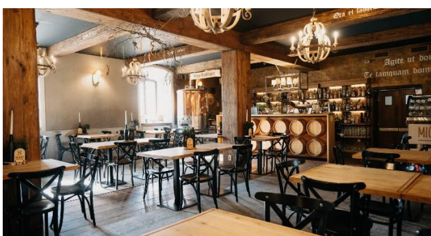
Fot.: 3 (RSM) – Restauracja Słód i Miód w Kościerzynie

W tym klimacie udamy się na wspólne śniadanie do Restauracji Słód i Miód . Powstała w 2023 roku, w budynku Starego Browaru. Restauracja o ciepłych wnętrzach, w rodzinnej atmosferze z nawiązaniem do historii browaru z 1856 roku, serwowana jest prawdziwa polska kuchnia.