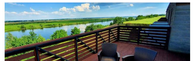
Fot.: 10 (HnW) – Tczew - Hotel nad Wisłą & Gościniec

Po pełnym wrażeń dniu udamy się na wspólną obiadokolację do Hotelu nad Wisłą w Tczewie.