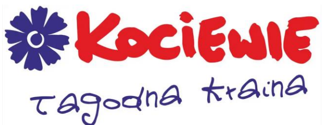
Rysunek 1 – Kociewie