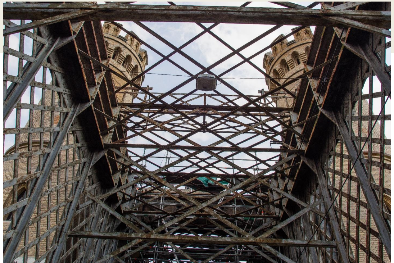
Fot.: 5 (Internet) – Most Tczewski to jeden z najpiękniejszych i najciekawszych zabytków Pomorza z końca XIX w.