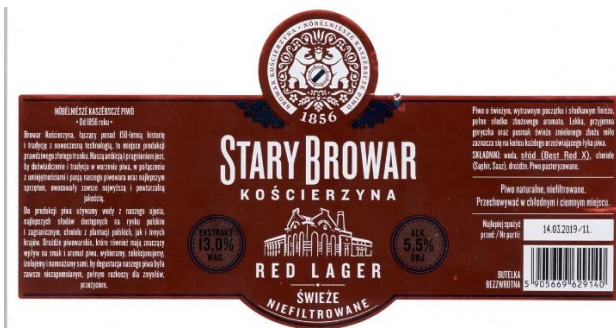
Fot.: 2 (SBK) – etykieta z butelki piwa

Browar Kościerzyna jest połączeniem ponad stu sześćdziesięcioletniej historii i tradycji z nowoczesną technologią. To miejsce produkcji prawdziwego złotego trunku.