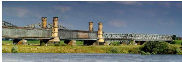
Fot.: 6 (PT) – Tczew - most kolejowy z 4 wieżami

Wiślane mosty stanowią szczególną atrakcję Tczewa, jako pierwszy, w latach 1851-1857, powstał most drogowy i był wówczas jednym z najdłuższych na świecie (837 metrów długości). Jego budowa kosztowała 4 miliony talarów. Kamień węgielny pod budowę położył Fryderyk Wilhelm IV.