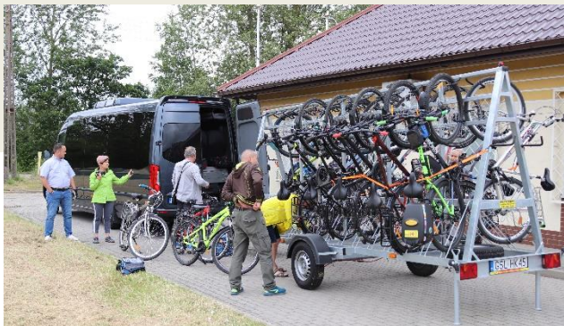
Fot.: 1 (WK) – Załadunek rowerów