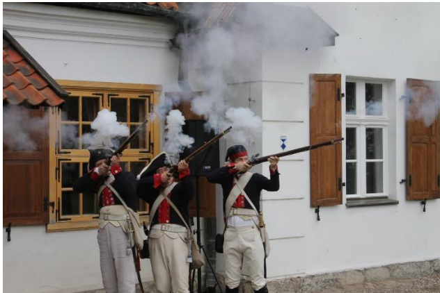
Fot.: 4 (MHN) – Noc Muzeów w 2016 r. w Będminie

Rola jaką odegrał w polskiej historii Mazurek Dąbrowskiego i jego autor, doprowadziły do podjęcia decyzji o utworzeniu w 1978 r. pierwszego na świecie Muzeum Hymnu Narodowego w Będminie, w którym 29 września 1747 roku na świat przyszedł Józef Rufin Wybicki. Zarówno tematyka zbiorów jak i charakter organizowanych wydarzeń związane są w pełni z promocją postaw patriotycznych i ugruntowaniu świadomości tożsamości narodowej. Zadanie zorganizowania nowego oddziału Muzeum Narodowego w Gdańsku powierzono historykowi Józefowi Błaszowskiemu.