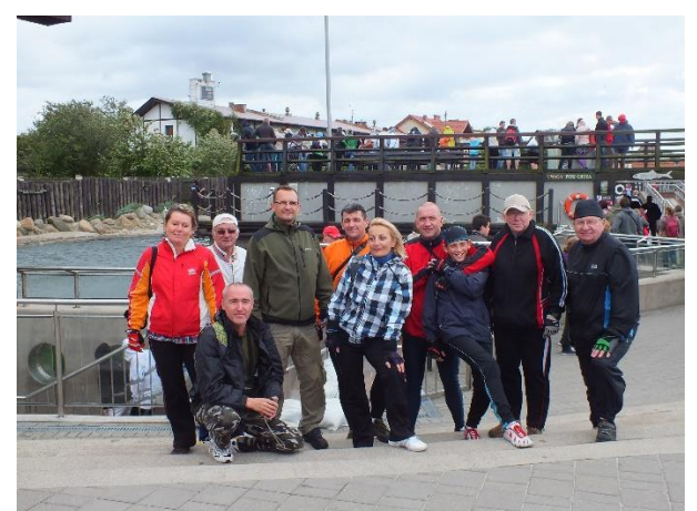
Fot.: 5 – Uczestnicy pierwszego rajdu rowerowego (plus Prezes za obiektywem) Go To Hel ze Szprychą – 20.08.2011 r.

Wiele osób uważa, że to najpiękniejsza droga rowerowa w Polsce. Nasze Stowarzyszenie też tak uważa i od 10 lat nieprzerwanie organizuje rajd rowerowy Go To Hel ze Szprychą. Nie jest to droga piekła, ale pełna atrakcji krajozawowych, przyrodniczych i historycznych miejsc.