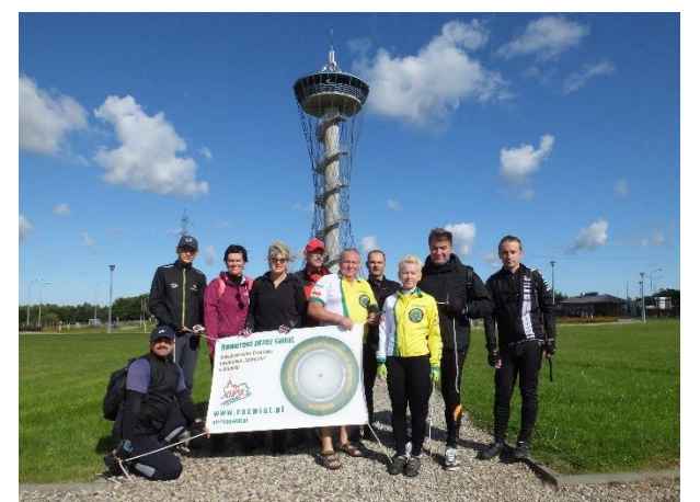
Fot.: 8 - Uczestnicy rajdu rowerowego (plus Prezes za obiektywem) "W poszukiwaniu Kaszubskiego Oka" - 21.09.2013 r.

Stowarzyszenie pojawiło się pierwszy raz w Gniewinie w 2012 r. podczas rajdu rowerowego „Gniewino i Jezioro Żarnowieckie”. Następnie organizowaliśmy jeszcze trzykrotnie rajdy rowerowe „W poszukiwaniu Kaszubskiego Oka”. W Gniewinie wejdzimy na wieżę o wdzięcznej nazwie Kaszubskie Oko. Roztacza się z niej przepiękny widok na jezioro Żarnowieckie i okoliczne krajobrazy. Bilet grupowy (min. 15 os.) – 8 zł.