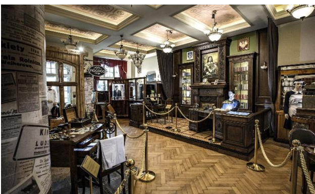
Fot.: 3 - Gabinet Teodora Bolduana, burmistrza Wejherowa

Zanim opuścimy Wejherowo pojedziemy zobaczyć Kalwarię Wejherowską, czyli zespół 26 kaplic ufundowanych przez wojewodę malborskiego Jakuba Wejhera – założyciela Wejherowa, na trzech wzniesieniach noszących nazwy: Góry Oliwnej, Góry Syjon i Góry Kalwarii. Kalwaria Wejherowska została zbudowana w latach 1649–1655.