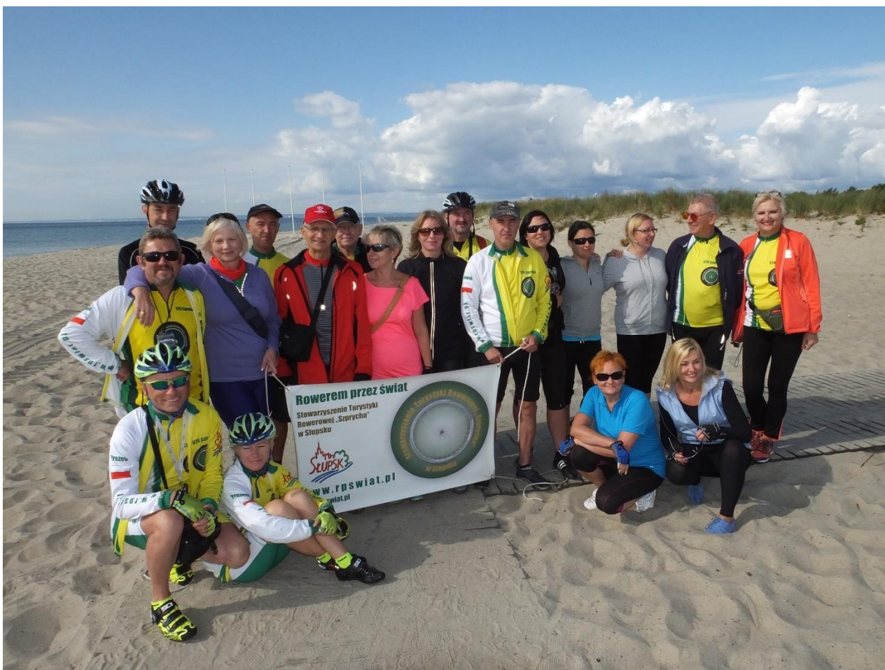
Fot.: 9 – Uczestnicy IV rajdu rowerowego „Go To Hel ze Szprychą” – 24.08.2014 r.

Źródło: Pomorskie! travel Muzeum Piąsnickie Wejherowo Turystyka