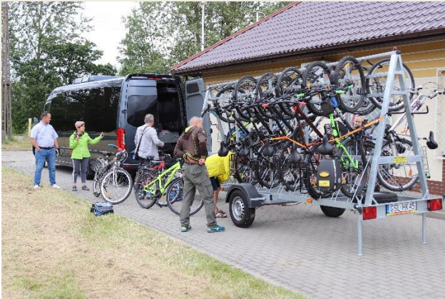
Fot.: 1 - Załadunek rowerów w Kobylnicy

GO TO HEL ZE SZPRYCHĄ – 29-30.08.2020 R.