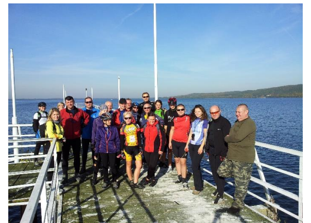
Fot.: 7 – Jezioro Żarnowieckie – uczestnicy rajdu rowerowego „Gniewino i Jezioro Żarnowieckie” – 20.10.2012 r.

O godzinie 10:00 wyruszymy rowerami w drogę powrotną. We Władysławowie zmieniamy kierunek jazdy na Morze Bałtyckie i zaczniemy podziwiać polskie wybrzeże. W Jastrzębiej Górze zatrzymamy się na wspólny obiad. Po deserze wyruszymy w dalszą trasę mijając po drodze miejscowości Karwia i Dębki, gdzie ostatecznie skęcimy w kierunku jeziora Żarnowieckiego.