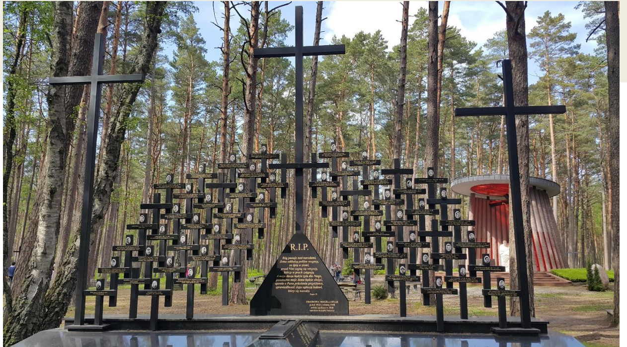
Fot.: 4 - Piaśnica – miejsce szeregu zbiorowych egzekucji Polaków przeprowadzonych przez okupantów niemieckich.