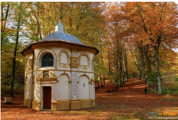
Fot.: 2 - Kalwaria Wejherowska

To już dziesiąty raz kiedy zmierzamy w kierunku Helu, ale pierwszy raz będzie to rajd dwudniowy. Zaraz po rozładowaniu rowerów udamy się na śniadanie do pobliskiej restauracji.