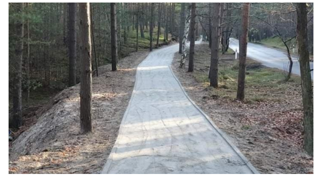
Fot.: 6 - Droga do Helu w remoncie

Nocleg po trudach całonocnej wędrówki będzie w Hostel Cypel na ul. Kuracyjnej 26 w Helu. Wszyscy otrzymają pościel.